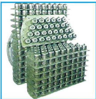
BUBBLE CAP TRAY